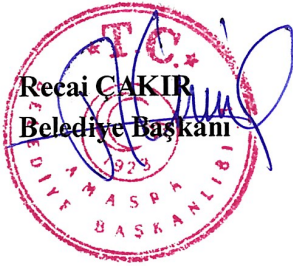
Recai ÇAKIR Belediye Başkanı

İlçemiz Kum Mahallesi Dizinler Sokak tapuda E28-c-03-b-1-b, E28-c-03-b-2-a, E28-c-03-b-1-c, E28-c-03-b-2-d paftalarına isabet eden, yazı ekindeki krokide görüleceği üzere 329 ada 14-15-16-17-18-19-20-21 parselleri kapsayacak alanda, 3194 sayılı İmar Kanununun Parselasyon Planlarının Hazırlanması başlıklı 18.maddesi ve Arazi ve Arsa Düzenlemeleri Hakkındaki Yönetmeliğin Düzenleme Sahalarının Tespiti ve Esasları başlıklı 9. Maddesinin 1. ve 2. Fıkraları uyarınca parselasyon planı yapılacak alan olan 1 Nolu Düzenleme Sahası, Mezkûr Yönetmeliğin Düzenleme Sınırının Geçirilmesi başlıklı 10. Maddesinin 2. Fıkrası uyarınca parselasyon planı yapılacak alanın dış sınırı olan 1 Nolu Düzenleme Sınırı belirlenmiş olup 1 Nolu Düzenleme Sınırında, 3194 sayılı İmar Kanununun 18. Maddesi olan 'Arazi ve Arsa Düzenlemesi' uygulaması yapılmasında ilgili birimce talep yazısı ekinde hazırlanan dosya ve 17.10.2022 tarihli teknik rapor doğrultusunda Belediye Encümenimize sunulduğu şekli ile kabulünün uygun olduğuna, ilgili iş ve işlemlerinin yapılması için İmar ve Şehircilik Müdürlüğüne gönderilmesine, Belediye Encümenimizce oy birliği ile karar verilmiştir.